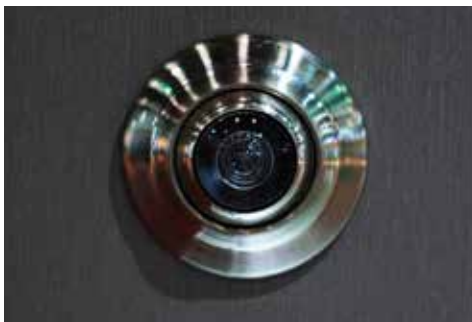
Oeil de Boeuf