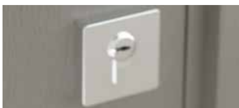
Serrure Italienne BONAITI Petite Clé