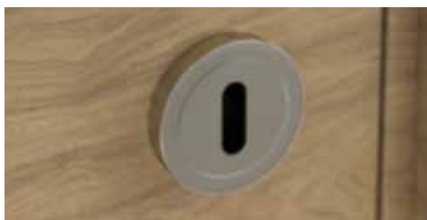
Serrure Grande Clé