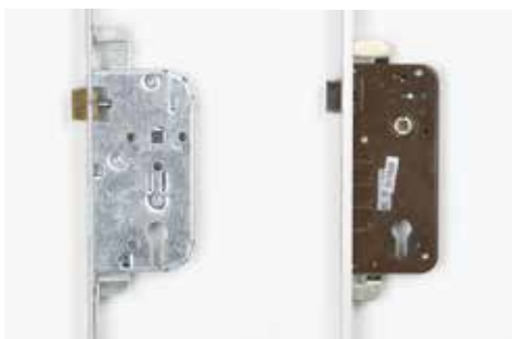
Serrure à 1 ou 3 Points de Sécurité