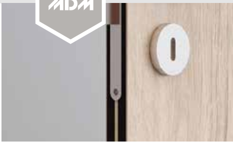
Serrure Petite Clé Coupe Feu