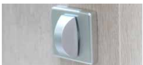
Serrure Italienne BONAITI Condamnation